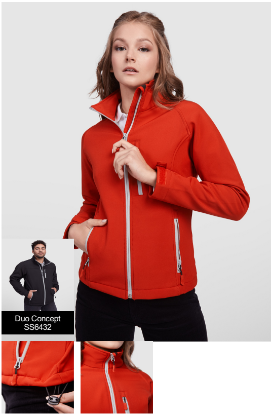
Duo Concept SS6432